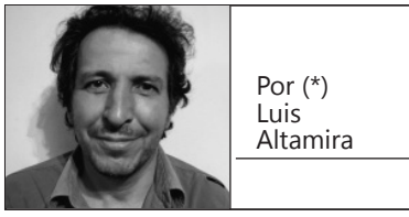
Por (*) Luis Altamira