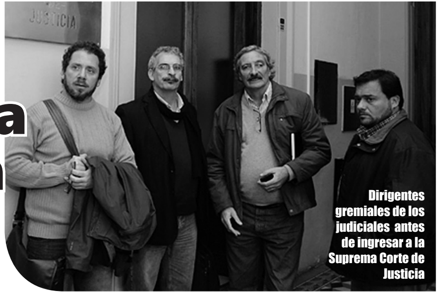
Dirigentes gremiales de los judiciales antes de ingresar a la Suprema Corte de Justicia

De la misma manera, la corte de justicia, evita que los juzgados y tribunales dejen de funcionar debido a la protesta judicial. "Los Jefes de las