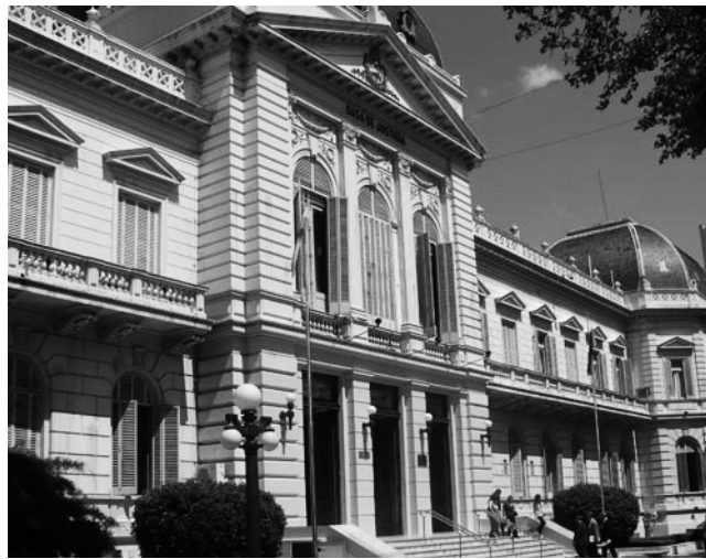
Suprema Corte de Justicia con sede en La Plata

1) Exigir a los tres poderes del Estado, cada uno en la esfera de su competencia, la inmediata solución del conflicto.